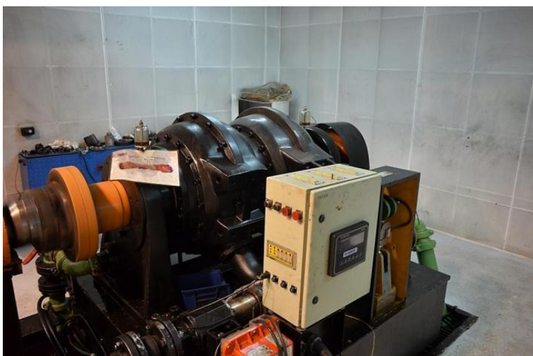
Imagem 5: Detalhes do dinamômetro