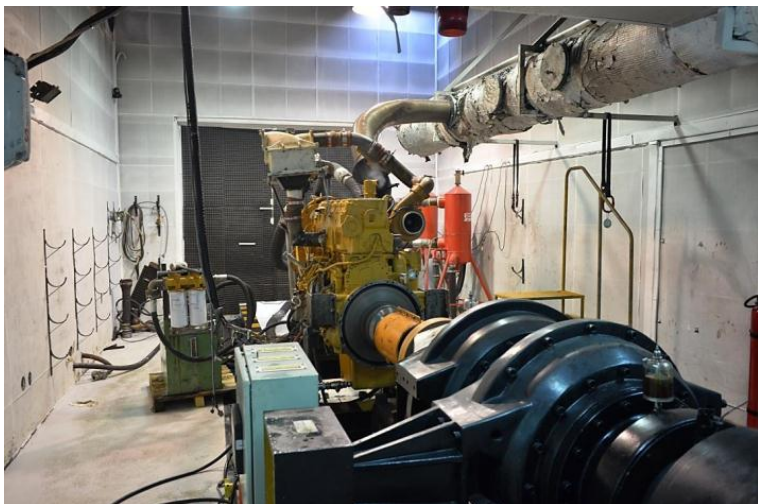
Imagem 3: Sala de teste