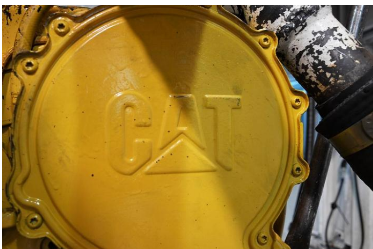
Imagem 4: Detalhes do motor testado