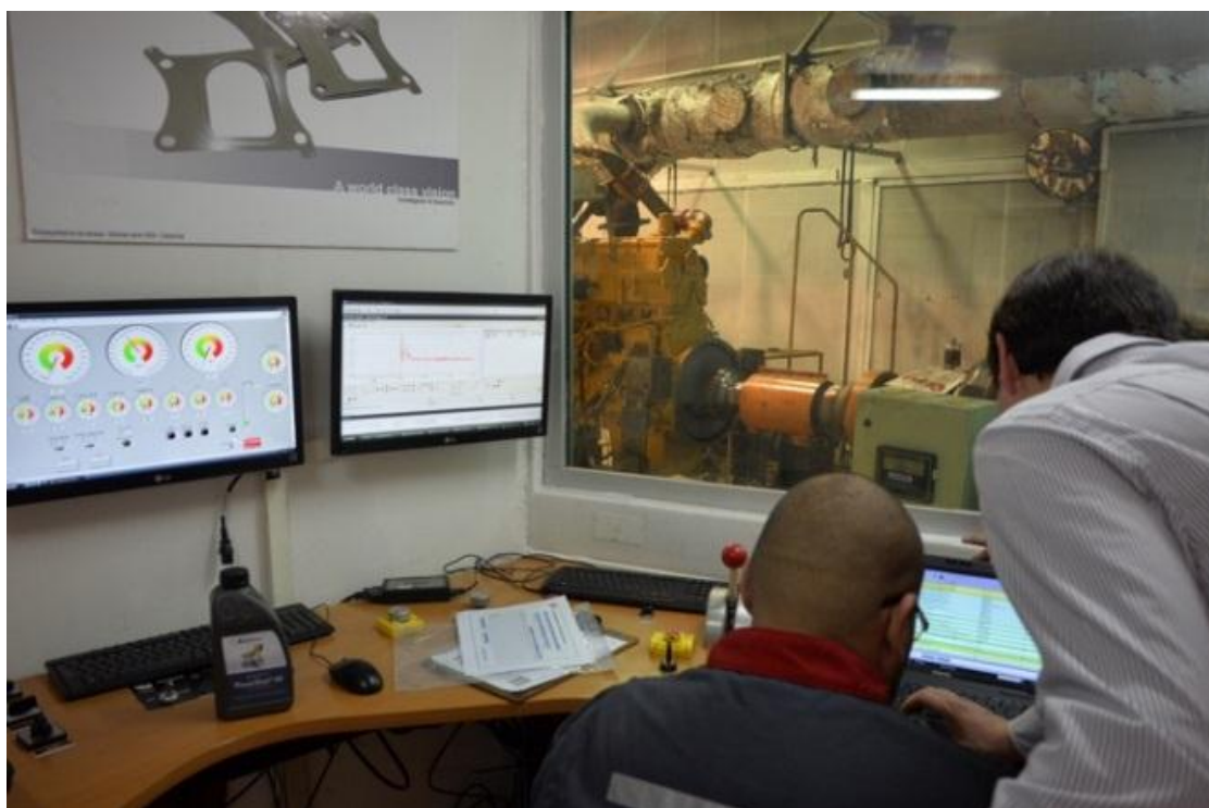
Imagem 2: Sala de controle

Uma medição precisa da eficiência do combustível na mina durante as operações é quase impossível, devido a diferentes razões. Cada dia da trabalho é diferente: caminhões trafegam com cargas diferentes na mais variadas rotações, até as temperaturas, a pressão dos pneus e do vento impactam sobre o consumo de combustível.